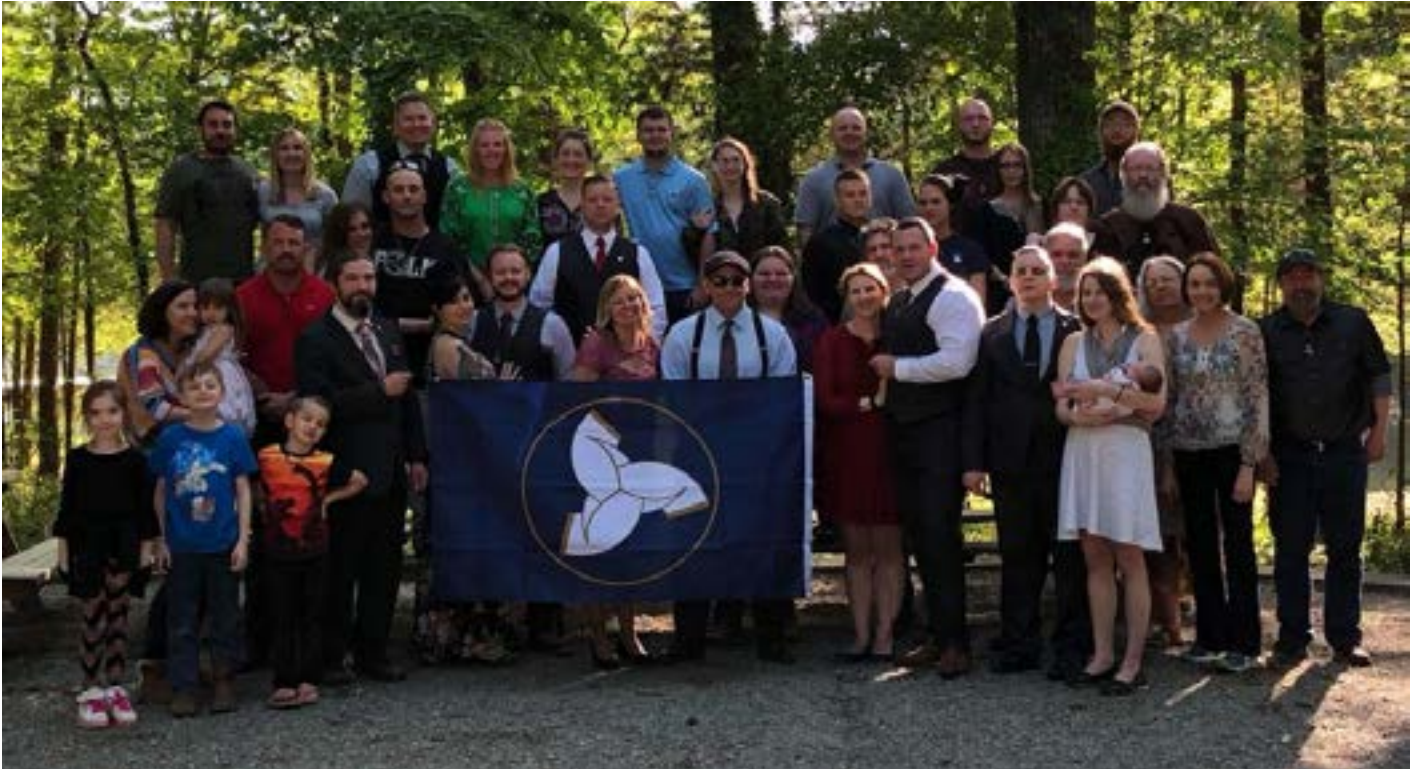
Die Asatru Folk Assembly-kerk

gedrag wat vernietigend van die blanke gesin is, ontmoedig moet word.”