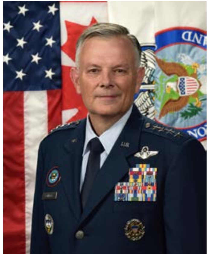
Genl. Glen Van Heck

In verband met die Paris Accord (Parys-Ooreenkoms) doen dit hoegenaamd niks aan die sogenaamde bedreiging van klimaatsverandering nie. Om die waarheid te sê, die Ooreenkoms doen alles moontlik