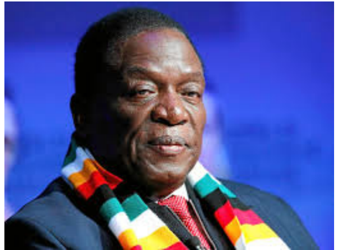
Pres. Emmerson Mnangagwa

Wat vreemd is, is dat wanneer Zimbabweërs heimwee uitspreek oor Robert Mugabe, dan weet jy