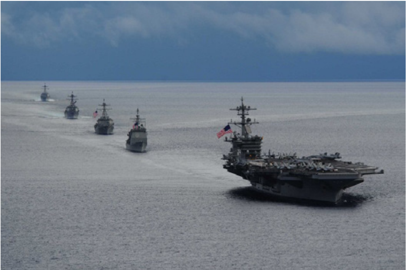
Harry Truman vliegdekskip op pad na Sirië