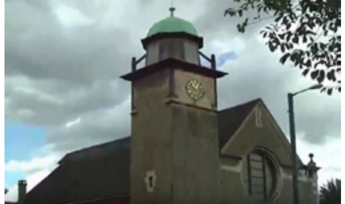
‘n Kerk word omskep in ‘n moskee

mis. By die Kerk van Santa Maria was daar slegs 20.