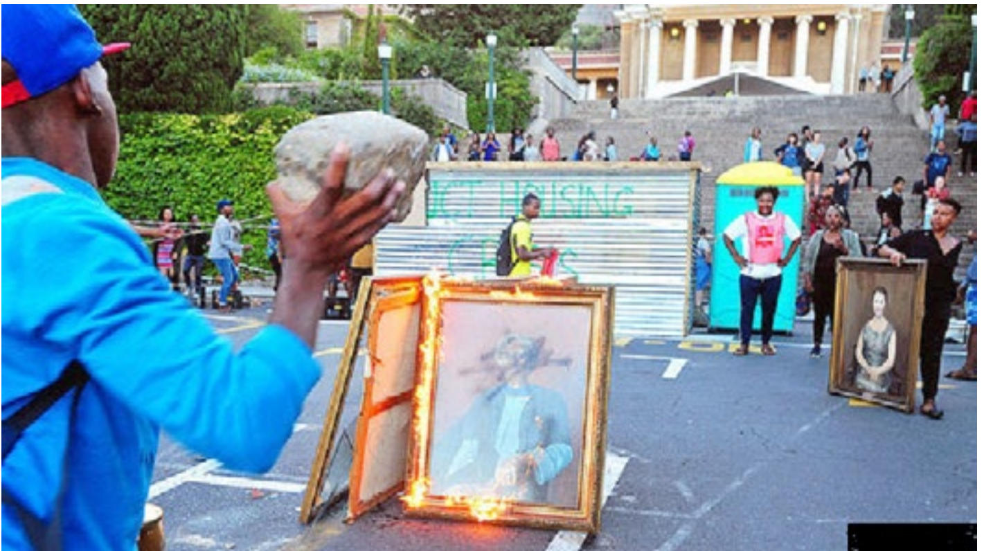
Waardevolle skilderye van Johannesburg Universiteit word vernietig