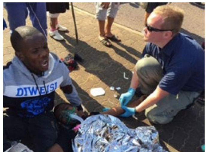
'n Man is in die maag geskiet. Sy toestand is ernstig.