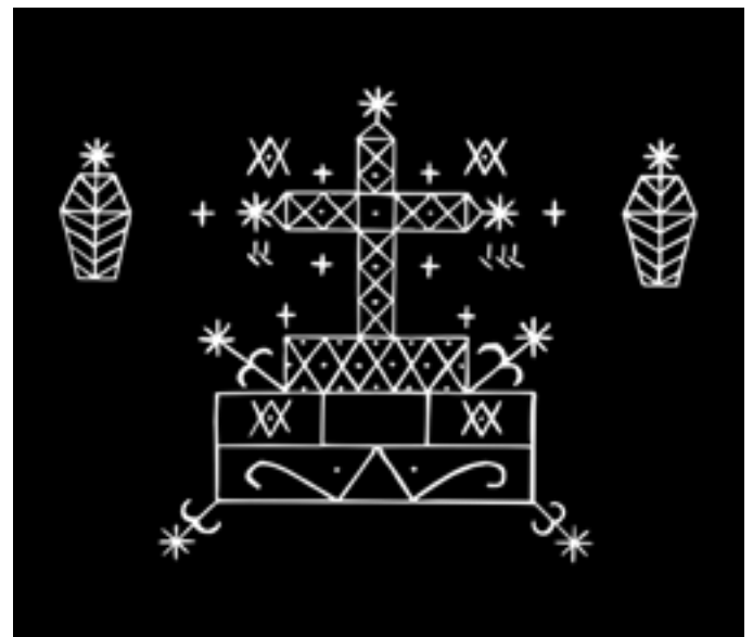
Die ooreenkomste met die Katolieke se altaar is baie duidelik.

Volgens die legendes was die oorspronklike boek geskryf deur Satan en kan dit nie verbrand of beskuldig word op enige normale manier nie. Maar oor waar die boek presies vandaan kom, kan net gespekuleer word.