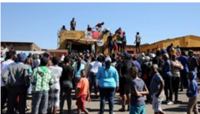
Uitlanders se winkels is geplunder en aan die brand gestee.