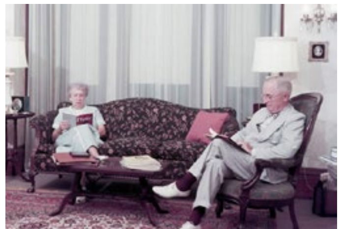
Harry Truman en sy vrou, Bess.

Later selfs, op 6 Mei 1971, toe die Kongres voorberei het om vir hom ‘n Eremedalje te gee, het hy dit geweier en aan hulle geskryf: “Ek sien dit nie dat ek enigiets gedoen het wat ‘n rede kan wees vir enige toekenning nie, kongressioneel of andersins.”