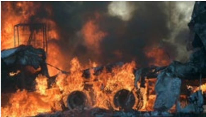
Groot trokke is aan die brand gestee en miljoene rande se skade is aangerig.