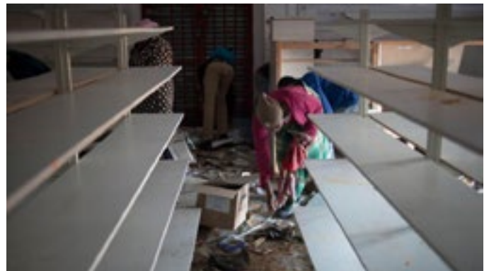
Eers is die rakke heeltemal leeg gemaak