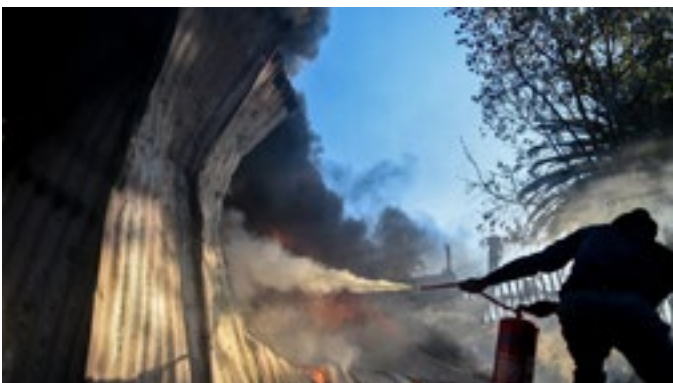
Brandweermanne probeer die vlamme blus.