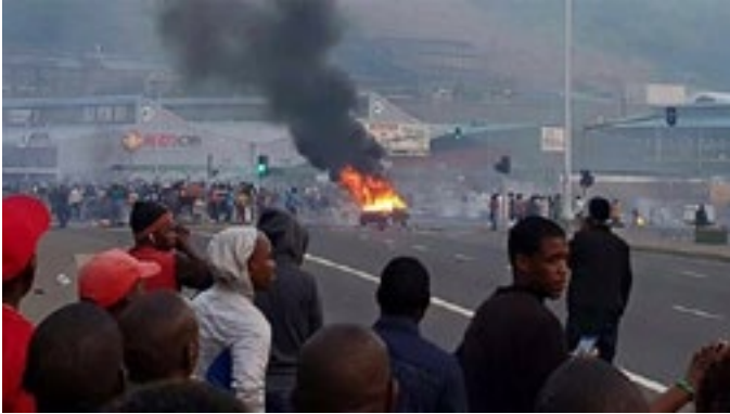
Paaie is versper