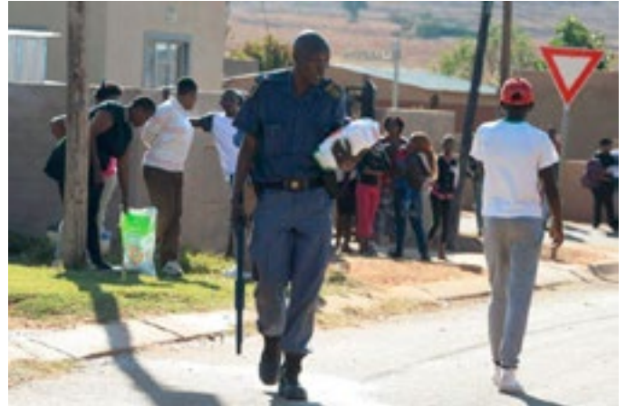
Polisieman help homself