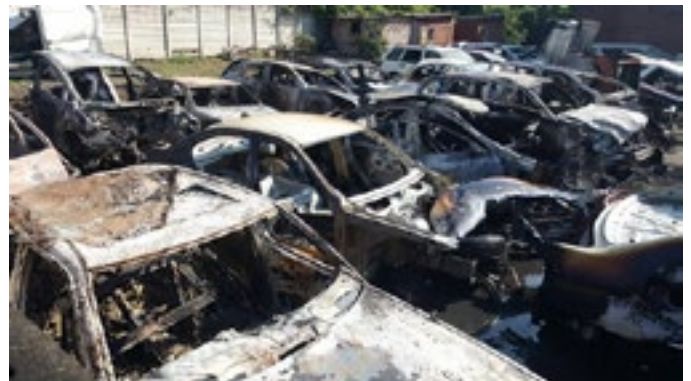
motors uitgebrand by 'n paneelklopper.