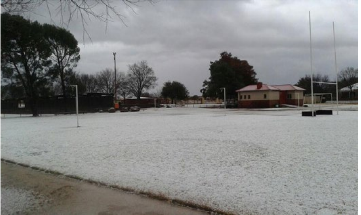
Die skool op Wolmaransstad. Siener van Rensburg was ouderling in die Hervormde Kerk op Wolmaransstad. Daar het nog nooit in die geskiedenis sneeu op daardie dorp geval nie en Siener sou met rede kon sê: Dit is die koudste winter.

gaan nog goed met die land omdat hulleself in goeie poste sit en hoë salarisse ontvang, maar dit is nie die hele prentjie nie.