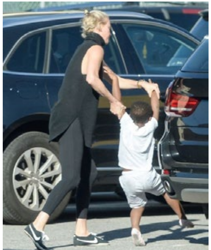
Charlize Theron word kwaad omdat sy nie haar swart aangenome klonkie kan beheer nie. Wat het sy dan verwag?

Volgens Netwerk24 het die Suid-Afrikaanse “lief-lingaktrise”, Charlize Theron, op 18 Julie “in ’n hartstogtelike toespraak gesê dit is nie nét seks wat MIV versprei nie, maar ook seksisme, rassisme en homofobie en armoede.”