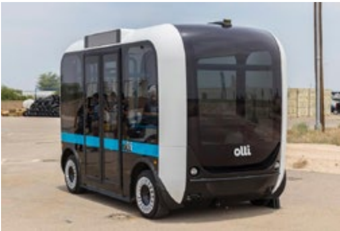
Die selfrybus. Dit het geen bestuurder nie en word ook 3D gedruk!

Toe jy jou werks 'hub' ingaan, merk jy op dat al die slaap 'pods' in gebruik is – daar moes 'n deurnag konferensie gewees het. Aangesien dit tyd is vir jou, stel jou AI jou in kennis dat die navorsing wat jy op pad aangevra het, byeengebring is, opgesom en beskikbaar is vir bespreking. Jy prop 'n klein toestel in en die navorsing projekteer vir almal om te sien.