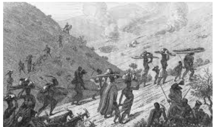
Die Difaqane van swartes het plaasgevind nadat die Blankes in Suid-Afrika aangekom het.

“Leuen nommer vier: Blankes het swart tuislande geskep.