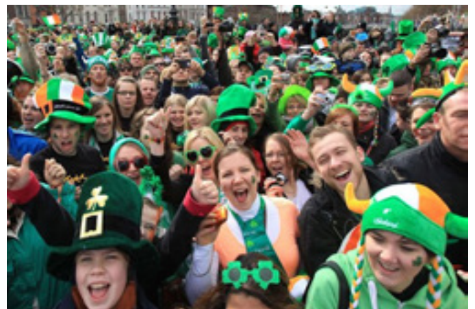
Iere vier hulle onafhanklikheid

In November 1921 vertel Siener die volgende gesig oor Ierland se onafhanklikheid van Engeland aan 'n groepie vriende wat hom op sy plaas Rietkuil besoek het: "Ierland sien ek as 'n los koringgerf wat van 'n wa (Engeland) afgegooi word."