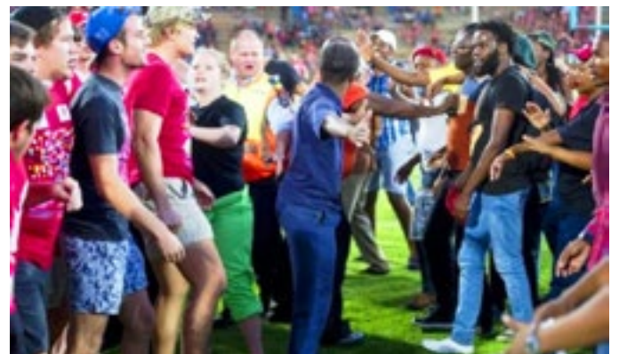
Altyd maar dieselfde deuntjie en niks verander nie.