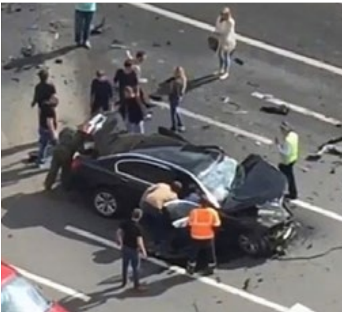
Vladimir Putin se ampsmotor in betrokke in 'n kop-aan-kop botsing in Moskou wat die Russiese president se 'geliefkoosde chauffeur' laat sterf het.

Dis nie dikwels dat daar vir 'n staatshoof van 'n supermag so 'n dramatiese en gewelddadige boodskap gestuur word nie. Daar word vermoed dat agente van die VSA en Brittanje wat in Moskou self is, die aanslag beplan en uitgevoer het.