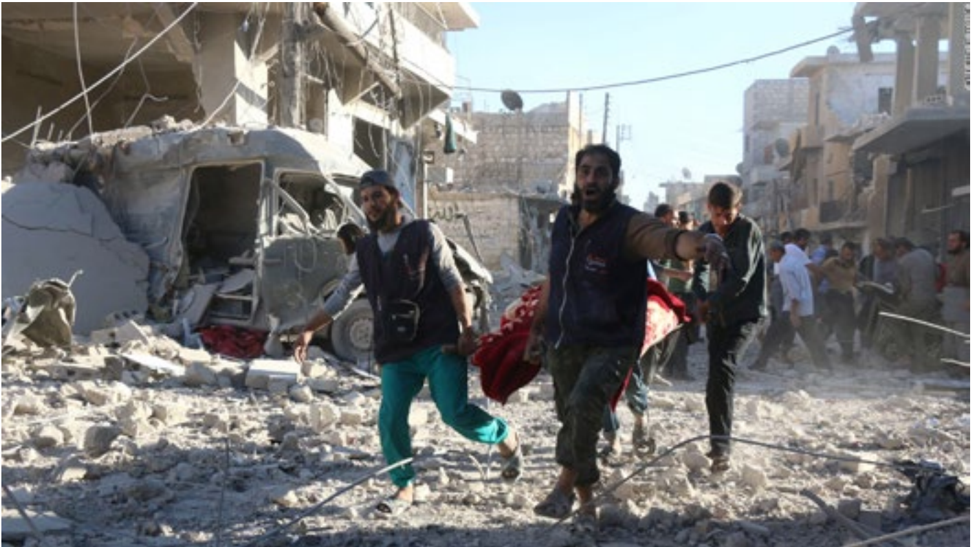
Trump se bombardering van Sirë

valse vlage wat deur die media opgesteek is. So 'n valse vlag-insident kan egter geweldige reperkussies hê as die leiers nie wakker loop nie.